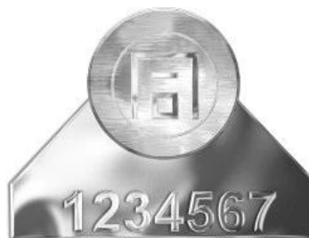
水量計「同」字檢定合格印證 (參考式樣)