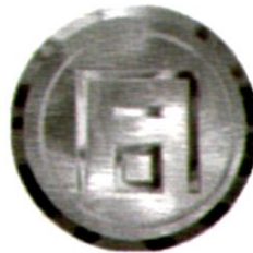
電度表「同」字檢定合格印證 (參考式樣)