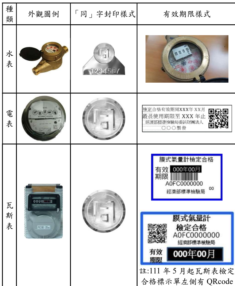
圖 2 家用三表「同」字封印及有效期限的樣式

掛表使用，民眾也能用得安心。經過檢定合格的家用三表，會附加專屬的「同」字封印及有效期限標示，以供民眾辨別。家用三表「同」字封印及有效期限標示的樣式如圖 2。