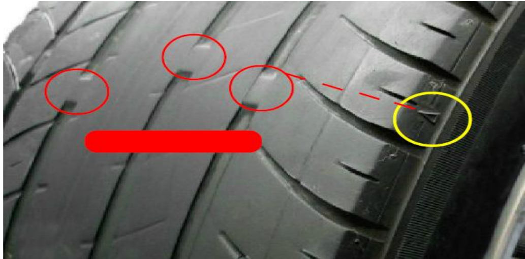
圖 3 輪胎溝紋已磨耗至指示平臺（須更換新胎）