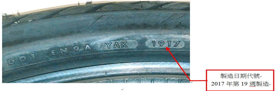
圖 1 製造日期代碼之標示圖例

造日期會標示於胎邊，由 4 個數字組成（如圖 1 所示），前 2 碼代表生產週別，後 2 碼代表生產年分（西元），例如：1917 代表西元 2017 年第 19 週製造。