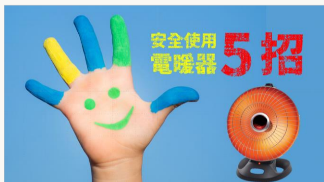
安全使用電暖器5招